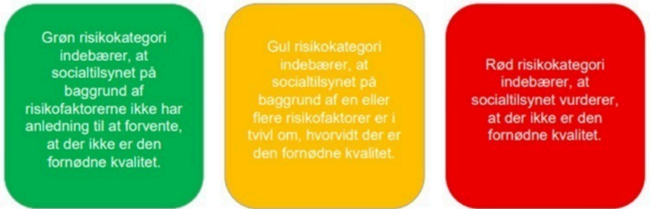
Figur 1. Risikokategoriseringsværktøj

Bemærk, at plejefamilier og tilbud altid er placeret i rød risikokategori, når der er en igangværende eller planlagt sanktion.